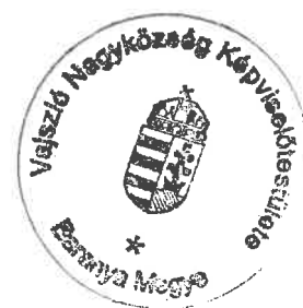
Horváth István polgármester